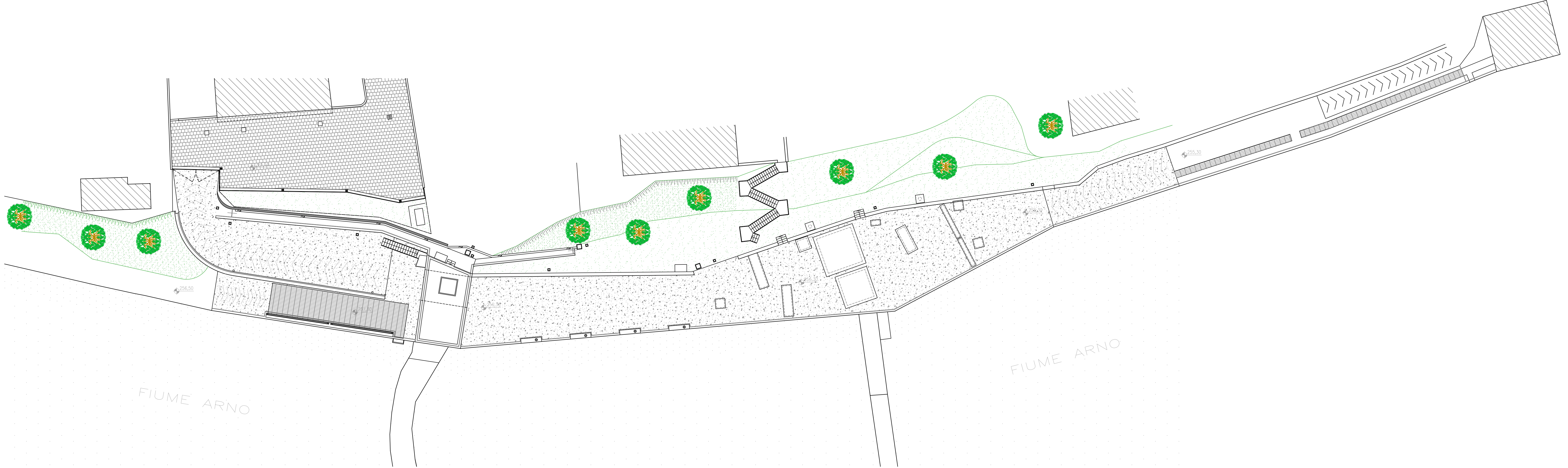
PLANIMETRIA GENERALE Scala 1:200

Data: LUGLIO 2016 Rev.: APRILE 2017 - Rev.: MAGGIO 2023 Scala: 1:200 Progettista esecutivo e Direttore dei Lavori Ing. PIERO ULIVIERI ORDINE INGEGNERI della Toscana e Pisa N° 973 Sezione A INGEGNERE CIVILE E AMBIENTALE Committente SEM s.r.l. Società Elettrica Maremmana s.r.l. Via Puglia, 6 - Fr.az. Albinia 58010 ORBETTELLO (GR) RIVA e C.F. 01117540532